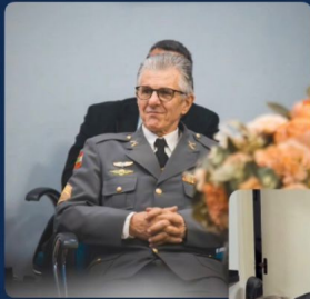
São Miguel do Oeste sc